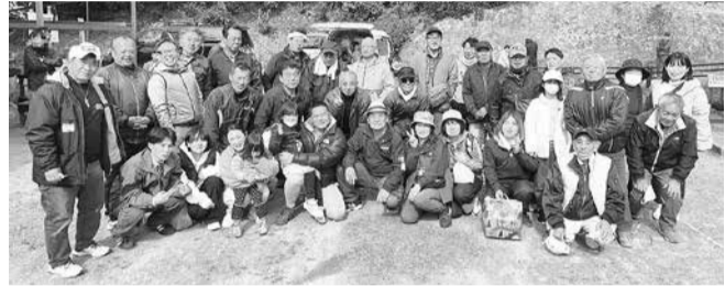
時津町・崎野自然公園

崎野自然公園はバーベキュー会場までは徒歩で、途中急勾配の坂を下りなければいけません。行きはよいよい帰りは怖い。いや、辛い。少年少女たちとは対照的に、大人たちはひいひいふうふう言っておられました。バーベキューでは、たくさんのお肉、やきそば、ホルモン、牡蠣、マシュマロ、ポップコーン、竹筒に入れた燗にした日本酒などなど、参加者も満足気。大人も子供も、家族で楽しめる分會行事として、また来年も開催できればと思います。