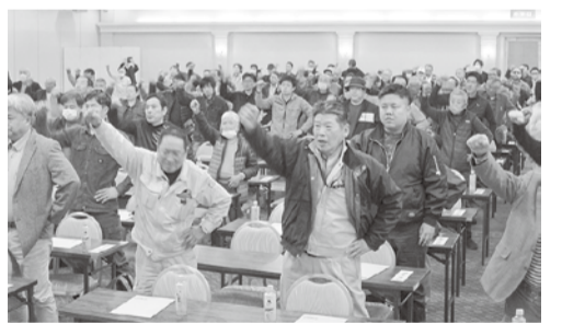
団結して頑張ろう!

十三連続して公共工事設計労務単価は上昇していますが、実質賃金はほとんど上昇しておらず、設計労務単価とは大きな開きがあるのが現状です。一方、第三次担い手三法が改正され、資材高騰に伴う労務費へのしわ寄せ防止や著しく低い労務費等による見積もりや見積もり変更依頼の禁止などが定められ、労働者の処遇改善や担い手確保が進められていきます。今後中小建設業協会と連携を図りながら、各自治体や大手建設業者に対して賃金の引き上げや労働条件改善、仕事確保の要望・要請を行っていきます。