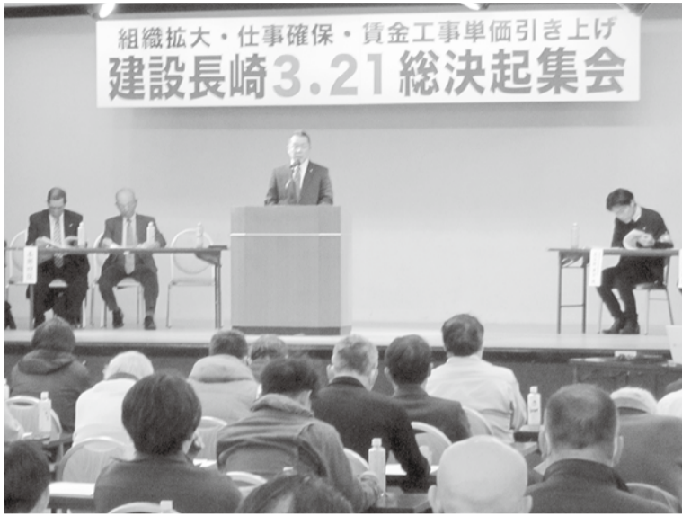
長崎新聞社文化ホール・アストピア

発行●長崎県建設産業労働組合 〒852-8021 長崎市城山町17番58号 TEL095-862-7121 FAX095-862-5281 http://www.kensetunagasaki.org/ 発行責任者●若杉孝雄 編集人●古井宏樹