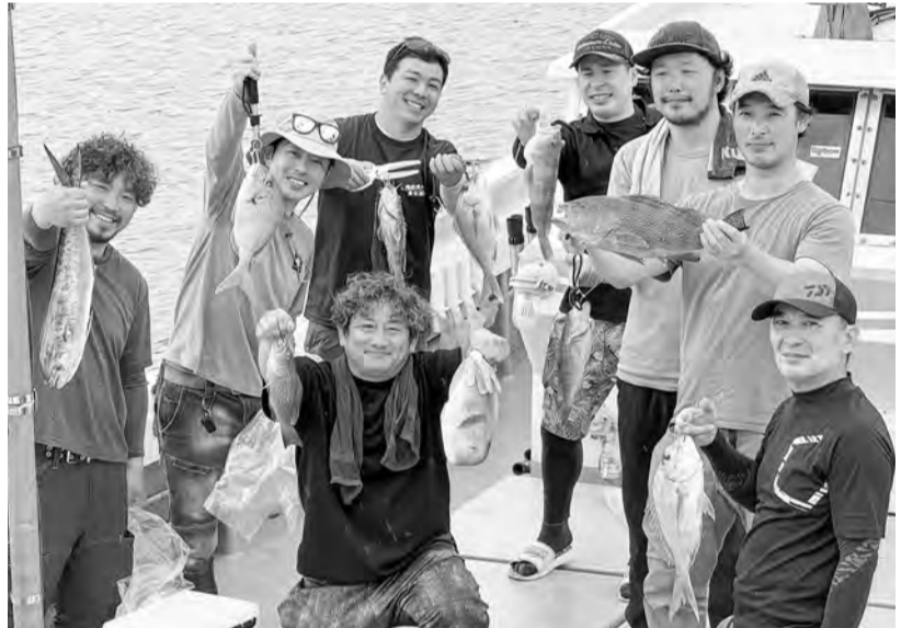
—釣り上げた魚を手にハイ・チーズ—