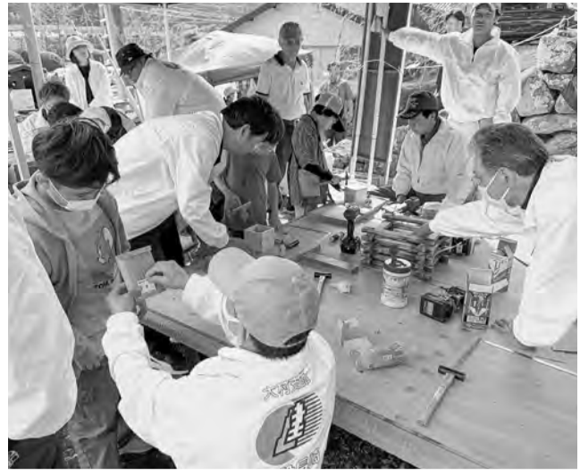
—優しく丁寧に指導する組合員さん—