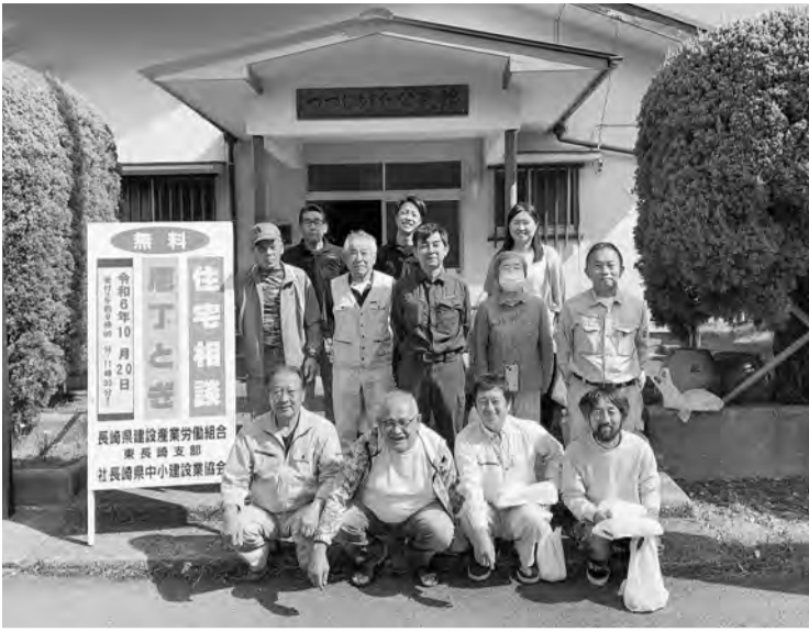
—つつじが丘中央公民館—