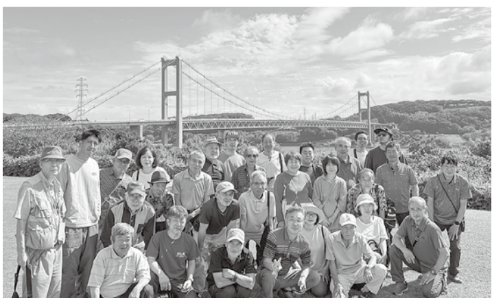
平戸大橋をバックに記念撮影

つかり、後に「かっぱ」であることが判明しこんにちまで「水のお守り様」として大切に保管されているミイラがあるところ。昭和三十年代まで使用されていた酒つくりの道具や農耕具も展示されており、「昔これ使ったよ」と懐かしんで話す方もいらつしやいます。メインの試飲もでき、満足してバスに乗り込み、今日のお宿平戸の「旗松亭」へ向かいました。到着して、皆さんがロビーに入った時に大粒の雨が滝のように降ってきた時に、本先に、樹齢三千年の大きく、見上げてのけ反る程の立派な姿に圧倒されました。少し、各部屋でゆつくり見学後、弓張の丘ホテルにて昼食をとり、帰路に着きました。この二日間天候に恵まれ、皆さん怪我、病氣なく無事に旅行ができました。大変お疲れ様でした。