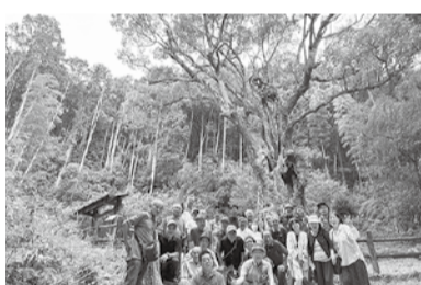
佐賀武雄神社の大楠

九月二十一日(土)〜二十二日(日)の二日間、大村支部では総勢三十名の参加で六年ぶり、そして十回目となる旅行を行いました。今回は、佐賀・唐津、長崎・平戸と近場での旅程となりました。