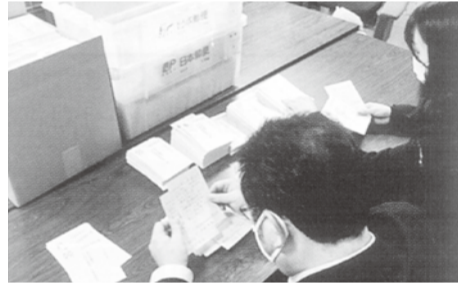
職員が一枚一枚内容を確認