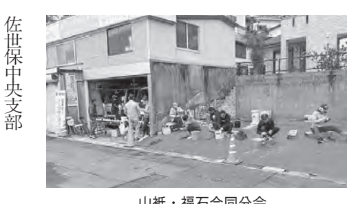
山祇・福石合同分会

コロナ禍により中止を余儀なくされ、今回四年振りの開催となり、どれだけの方にきて頂けるか心配でしたが、事前のお知らせや地域での放送もあり、総計一四九名のお客さんに来場頂き、一四一本の包丁、はさみ他を研ぎあげました。来場者からは、「待っていた」、「久しぶりの開催ですね」など、長い期間続けてきた地域への奉仕活動が根付いている面も垣間見えた半面、「知らなかった」との声も聞かれ、コロナ禍による中止期間の長さも感じられました。高齢化による研ぎ手不足が今後の課題ではありますが、今後とも可能な限り、住宅デーを継続させ、地域に根付いた活動が重要だと思えます。 何より組合員さん、主婦会の皆様のご協力でケガも無く無事終了する事が出来ました。感謝致します。 そして、建設長崎を地元の方々に少しでもアピール出来たと思います。 ご参加頂きました組合員主婦会の皆さん、大変お疲れ様でした。