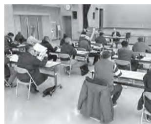
時津町北部コミセンにて

増改築相談員は、住宅リフォームを実施しようとする消費者が、安心して相談できる体制を整備し、住宅リフォームの普及促進と、居住水準の向上を図ることを目的に設けられています。建設長崎では、(公社)住宅リフォーム・紛争処理支援センターの委託を受け、五年毎に更新研修を行って