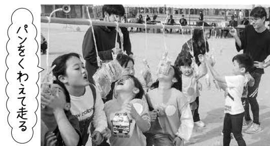
パンをくわえて走る