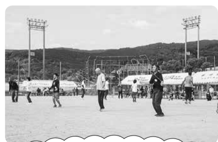
なわとび耐久レースに 勝ち残った強者