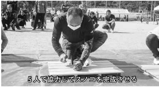
5人で協力してスノコを完成させる