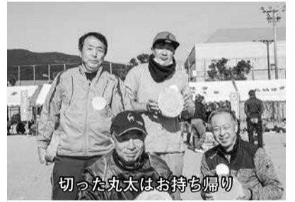
切った丸太はお持ち帰り