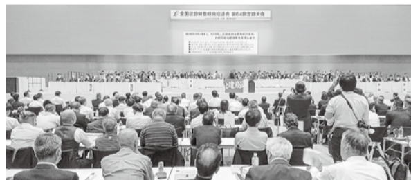
一群馬県高崎市「Gメッセ」

全建総連第六十四回定期大会は、「組織の力を結集し、百万人国会請願署名を成功させ、持続可能な建設業を実現しよう」をメインスローガンに掲げて、十月二十五日(二十七日)、群馬県高崎市「Gメッセ」で開催されました。今回はコロナ感染が五類に引き下げられたことを受けて、参加者が従来規模に戻り、五十二県連組合より一三四九名が集まりました。