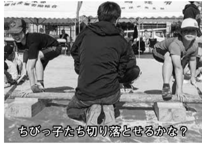
ちびっ子たち切り落とせるかな?