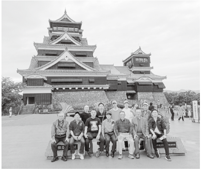
震災復旧後の熊本城にて