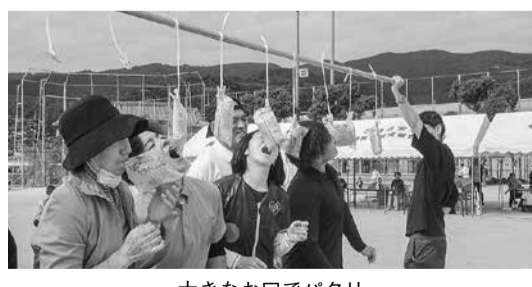
大きなお口でパクリ