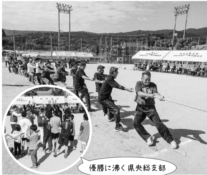
優勝に沸く県央総支部