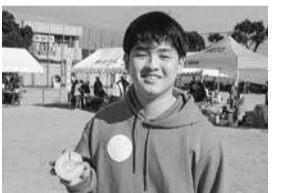
皆さんの笑顔がまぶしい