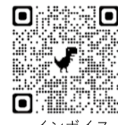
インボイス特設サイト