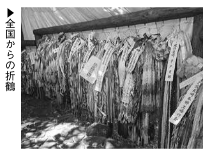
▶山形主婦会長による折鶴献納