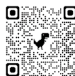
デジタル庁 gBizIDサイト

1つのID・パスワードで様々な行政サービスにログインできるサービスです。石綿の事前調査結果報告以外にも、建設業許可や、労働保険関係、社会保険関係の電子手続きが可能となります。