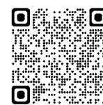
石綿総合情報ポータルサイト