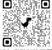
令和5年度税制改正関係（インボイス関連）