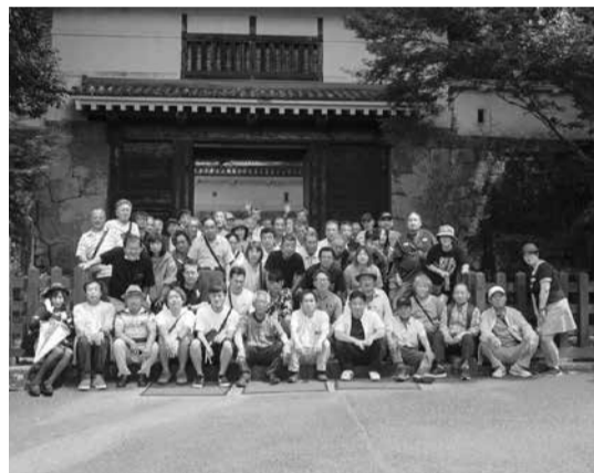
飲肥の城下町にて