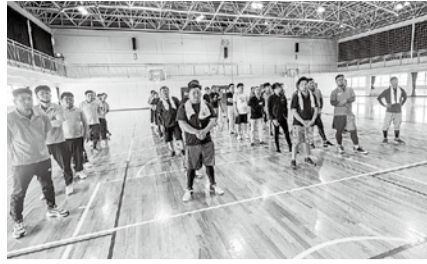
九州7県連組合より49名が参加

五月十四日(日)から十五日(月)にかけて、佐賀県佐賀市で九地協青年部交流集会が開催されました。