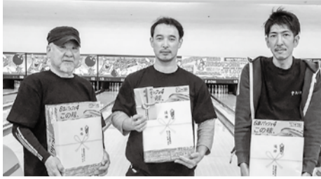
優勝 大村支部Aチーム

発行●長崎県建設産業労働組合 〒852-8021 長崎市城山町17番58号 TEL095-862-7121 FAX095-862-5281 http://www.kensetunagasaki.org/ 発行責任者●若杉孝雄 編集人●古井宏樹