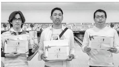
3位 諫早支部Bチーム