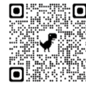
中小企業庁リーフレット