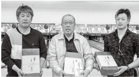
準優勝 佐世保北支部Bチーム