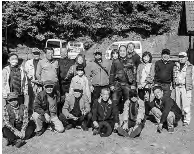
笑顔溢れる時津連合分会の皆さん