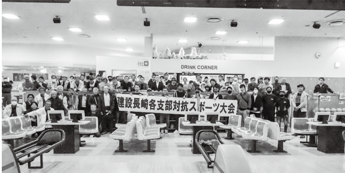
県下各地より97人が参加「大村Jボウル」