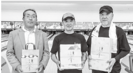
左から、ガター賞、ハイスコア賞、ストライク賞

四月二十三日(日)、建設長崎支部対抗ボウリング大会が「大村Jボウル」にて、四年ぶりにスポーツ行事として開催されました。コロナウイルスも収束に近づき、初めての試みでしたが、県下十五支部から団体二十五チーム、個人十二人の総勢九十七人が参加されました。団体戦は一チーム三人一組の二ゲーム合計スコアにより競い合い、優勝は大村支部Aチーム(合計八二二点)、準優勝に佐世保北支部Bチーム(合計七九八点)、三位に諫早支部Bチーム(合計七九七点)で、とても僅差の戦いになりました。