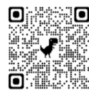
インボイス特設サイト

インボイスコールセンター 0120-205-553 受付時間9:00から17:00(土日祝除く)