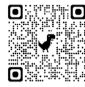
令和5年度税制改正関係（インボイス関連）