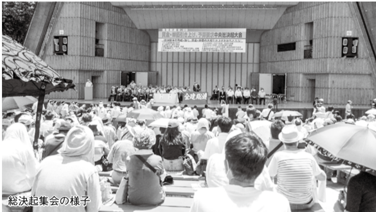
総決起集会の様子

発行●長崎県建設産業労働組合 〒852-8021 長崎市城山町17番58号 TEL095-862-7121 FAX095-862-5281 http://www.kensetunagasaki.org/ 発行責任者●若杉孝雄 編集人●古井宏樹