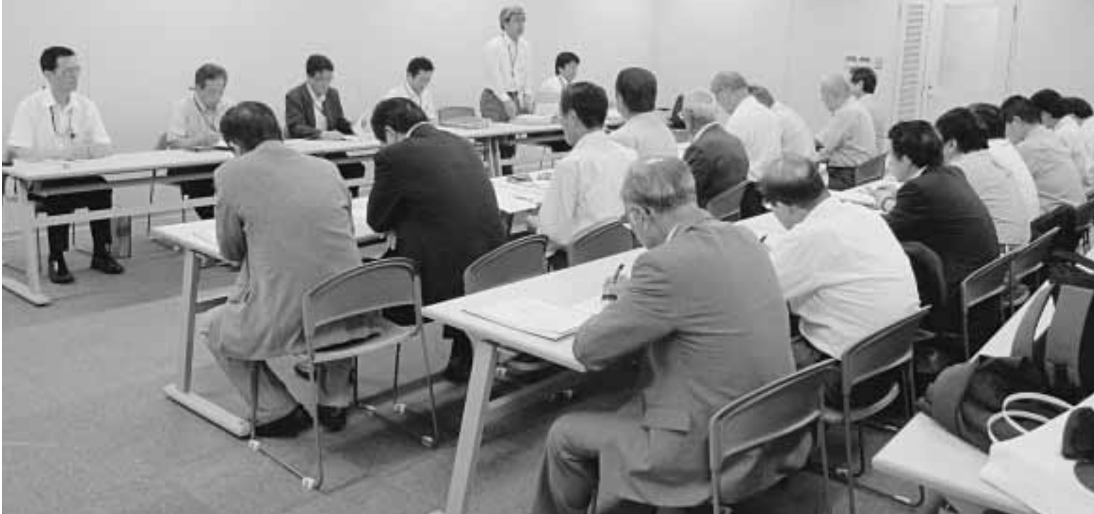
国土交通省九州地方整備局