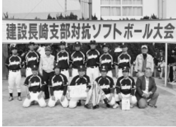
準優勝 諫早チーム