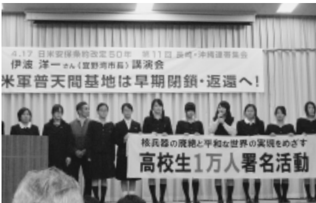
高校生1万人署名活動に参加

メーデー長崎会場では四、〇〇〇人を越える人達が水辺の森公園に結集しました。久しぶりの大人数による集会となったような気がしますが、どうだったのでしょうか。私も、昨年に引き続き、社民党代表として、参加した皆さんへ演壇であいさつする機会を頂きました。労働者派遣法の改正では派遣の一人一人の権利が守られる抜本改正を図ること。過労死や自殺対策についても相談窓口の設置などきめ細かな対応を行うこと。また、二三年間にも及んだJR不採用問題では、当初から解決のために取り組んだ社民党を初めとして四党合意により政治解決を勝ち取ったこと。その他、憲法に関連