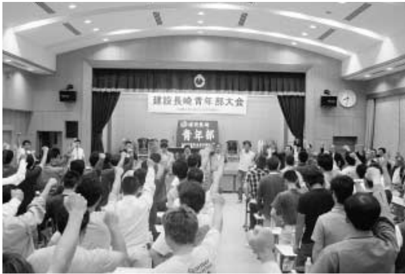
「団結がんばろう」で青年部大会を元気に閉めくくる

青年部大会が平成二十一年六月二十四日(水)午後七時から時津町北部コミュニティセンターで、青年層組合員、本部・支部役員、合わせて、全体一四三名参加で開催しました。