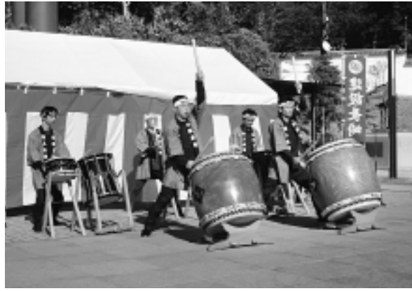
長崎歴史文化博物館

建設長崎「職人太鼓」は 平成二十一年年頭の一月二日と六日にそれぞれ太鼓の演奏を行いました。