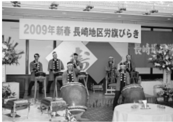
長崎地区労旗開き - セントヒル長崎

「れきぶん(歴史)のお正月」と題したイベントの中で、午前と午後それぞれ三曲づつ演奏披露を行いました。