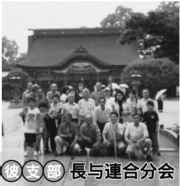
西彼支部 長与連合分会

西彼支部時津連合分会では、六月二十八日(土)から一日で旅行会を開催。今回の参加者は三十二名。雨が降る中、最初の目的地を目指し出発。 飯塚市にある「旧伊藤伝右衛門邸」は筑豊の炭鉱王の功績を伝える文化遺産で、その広大な敷地に造られた建物、庭園を皆さん熱心に見学。 また、築城四百年を迎えた熊本城では、職人さんらしく大改修を終え復元された本丸御殿や、改修工事の工程をビデオで熱心に観察しました。 その後、ホテルでの懇親