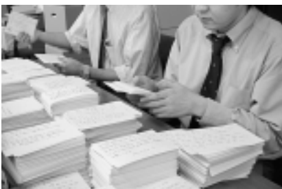
集まった八ガキを点検する厚生労働省職員

組合では、平成二十一年度国保助成金(補助金)の満額確保に向け、組合員・家族が、一六、七九五通の要請八ガキを集約。特に佐世保北、北松、平戸の三支部が目標の二・五倍を達成し、大きな力となりました。八ガキ要請は組合員と家族の声を直接伝える運動です。組合は山のように届いた八ガキを点検し、厚生労働省へ全通投函しました。 今回の八ガキ要請行動に、ご協力いただいた組合員・ご家族の皆様にごより感謝申し上げます。 尚、国は来年度の社会保障関係予算について、本年度同様一、二〇〇億円の圧縮を求めており、昨年以上に厳しい状況が考えられます。組合員、家族の皆様には年末の予算決定に向けて更に力強いご協力をお願いします。