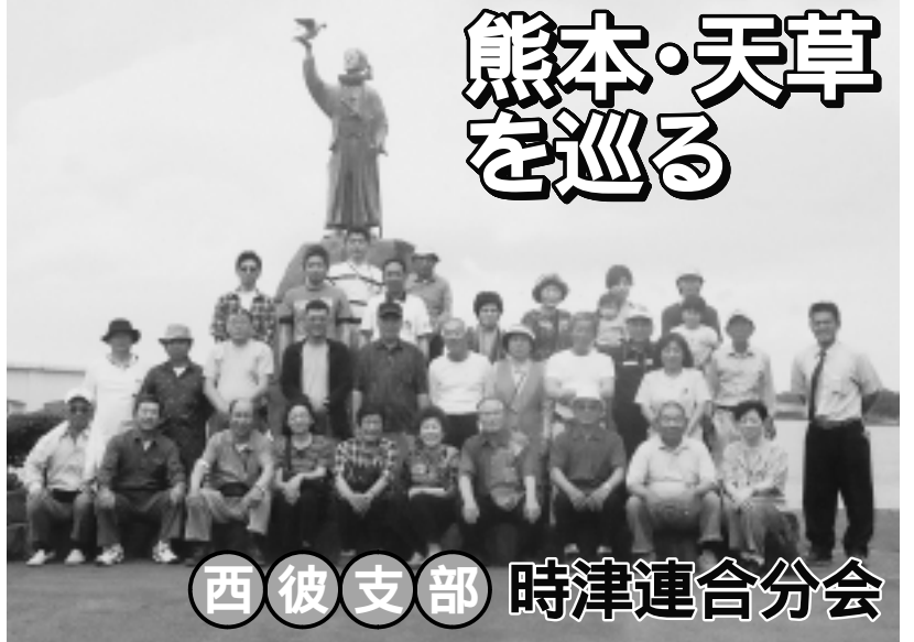
西彼支部 時津連合分会

西彼支部時津連合分会では、六月二十八日(土)から一日で旅行会を開催。今回の参加者は三十二名。雨が降る中、最初の目的地を目指し出発。 飯塚市にある「旧伊藤伝右衛門邸」は筑豊の炭鉱王の功績を伝える文化遺産で、その広大な敷地に造られた建物、庭園を皆さん熱心に見学。 また、築城四百年を迎えた熊本城では、職人さんらしく大改修を終え復元された本丸御殿や、改修工事の工程をビデオで熱心に観察しました。 その後、ホテルでの懇親